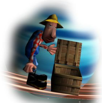
Gespeichertes Spiel laden