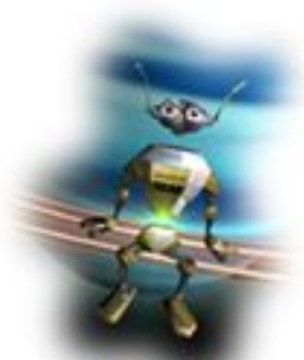
Neues Spiel starten