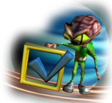
Spiel- und Steuerungseinstellungen